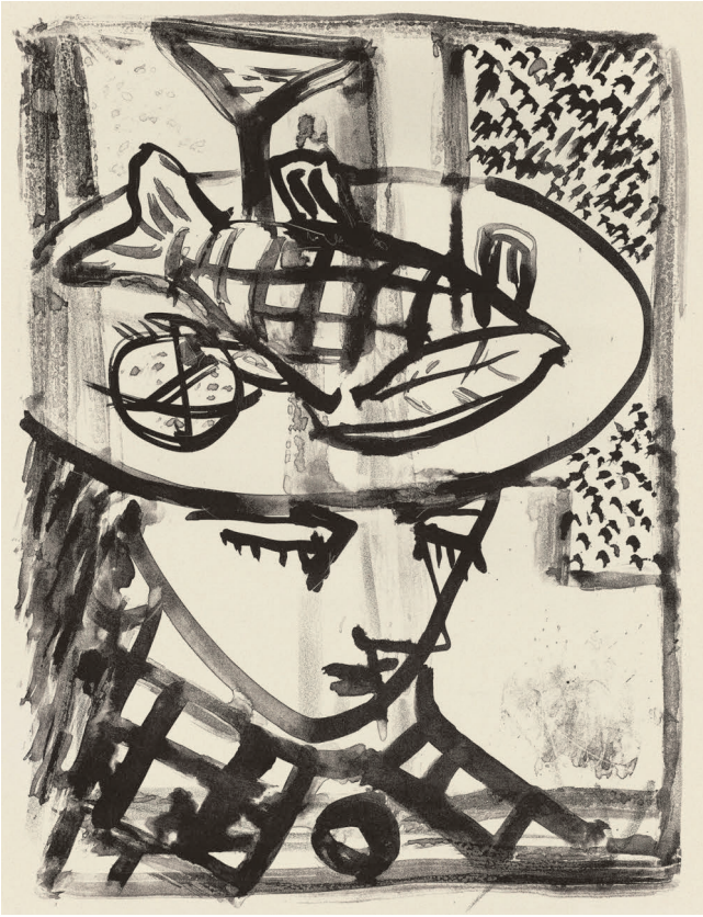
»Frau mit Fischhut«, 1982, Lithografie, 48,4 x 38 cm (Stein), WV 461