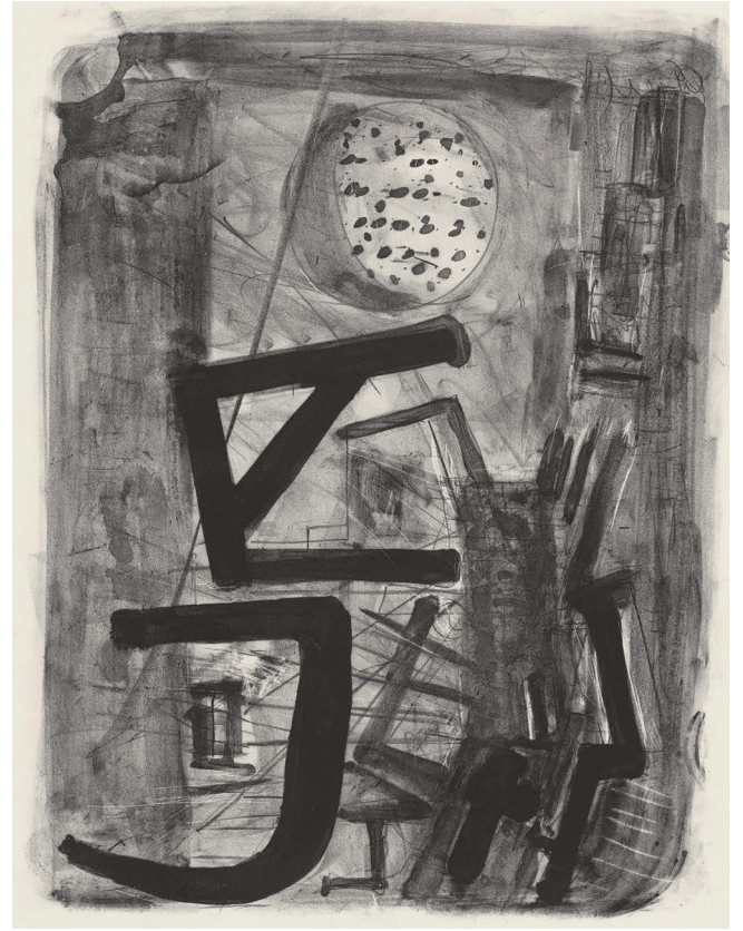
»Aaltogruß«, 2016, Lithografie, 70,3 x 54 cm (Stein), WV 824